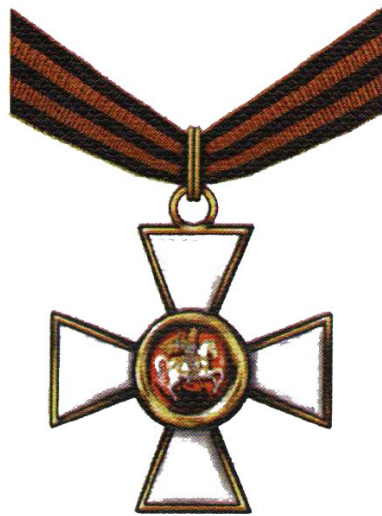
Орден Святого Георгия III степени