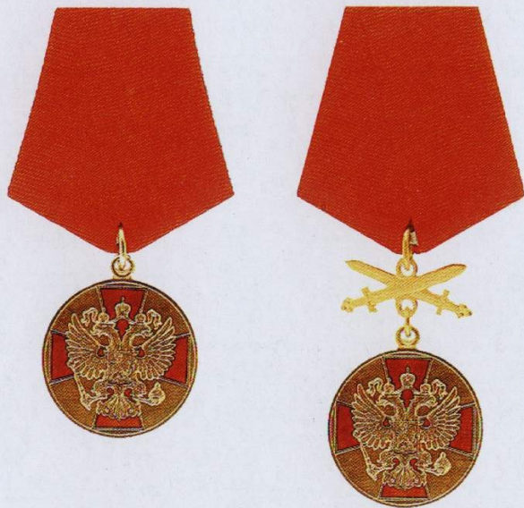
Медаль ордена «За заслуги перед Отечеством» I степени