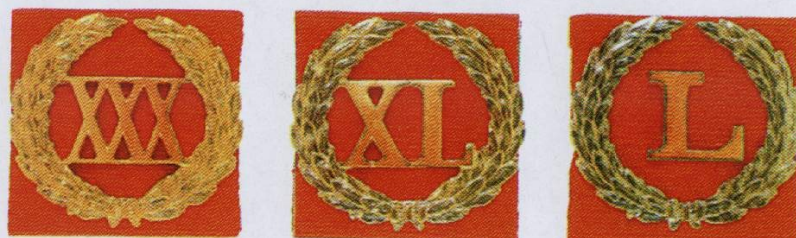
Знак отличия «За безупречную службу» (на ленте ордена «За заслуги перед Отечеством»)

Учрежден Указом Президента РФ от 2 марта 1994 г. № 442. Знаком награждаются граждане, избранные или назначенные на должность в соответствии с Конституцией Российской Федерации и федеральными законами, а также государственные служащие.