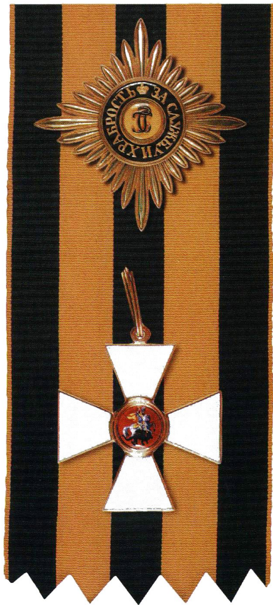
Звезда и знак ордена Святого Георгия I степени

Орден Святого Георгия — высшая военная награда Российской Федерации. Статут ордена утвержден Указом Президента РФ от 8 августа 2000 г. № 1463. Орден был учрежден Екатериной II 26 ноября 1769 г. Восстановлен 2 марта 1992 г.