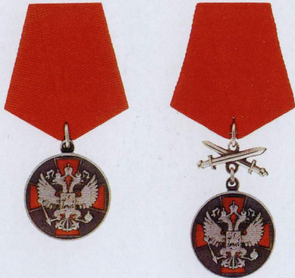
Медаль ордена «За заслуги перед Отечеством» II степени

Учреждена Указом Президента РФ от 2 марта 1994 г. № 442. Медалью награждаются граждане за осуществление конкретных и полезных для страны дел в промышленности и сельском хозяйстве, строительстве и на транспорте, в науке и образовании, здравоохранении и культуре, в других областях трудовой деятельности; за большой вклад в дело защиты Отечества, успехи в поддержании высокой боевой готовности подразделений, частей и соединений, за отличные показатели в боевой подготовке и иные заслуги во время прохождения военной службы; за укрепление законности и правопорядка, обеспечение государственной безопасности.