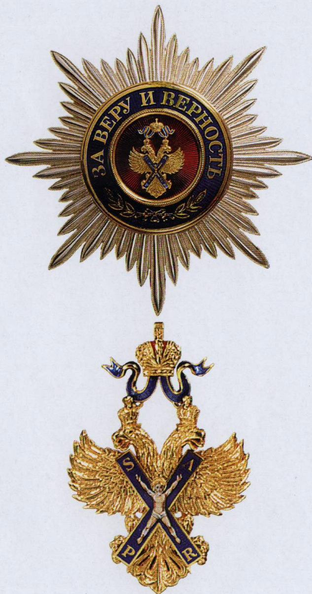
Звезда и знак ордена Святого апостола Андрея Первозванного

Орден Святого апостола Андрея Первозванного является высшей государственной наградой Российской Федерации. Он был учрежден Петром I и восстановлен Указом Президента России от 1 июля 1998 г. № 757.