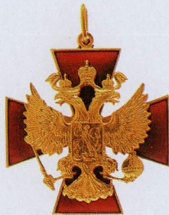
Звезда и знак ордена «За заслуги перед Отечеством» II степени