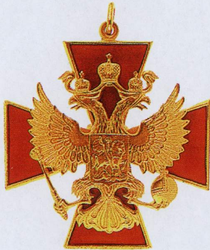
Звезда и знак ордена «За заслуги перед Отечеством» I степени

Орден «За заслуги перед Отечеством» учрежден Указом Президента РФ от 2 марта 1994 г. № 442. Им награждаются граждане за особо выдающиеся заслуги перед государством, связанные с развитием российской государственности, достижениями в труде, укреплением мира, дружбы и сотрудничества между народами, за значительный вклад в дело защиты Отечества.