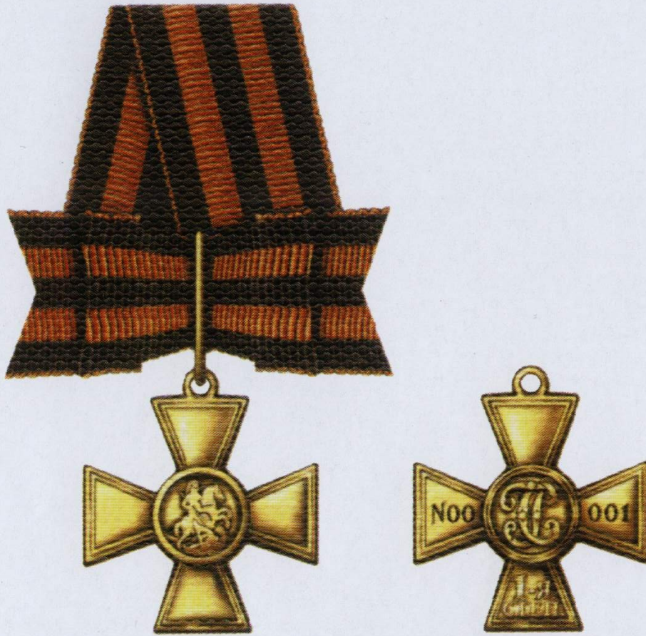
Знак отличия — Георгиевский Крест I степени

Положение о знаке отличия — Георгиевском Кресте утверждено Указом Президента РФ от 8 августа 2000 г. № 1463. Знак отличия Военного ордена был учрежден в 1807 г., который в 1913 г. получил название Георгиевский Крест. Восстановлен 2 марта 1992 г.