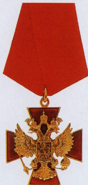
Орден «За заслуги перед Отечеством» III степени