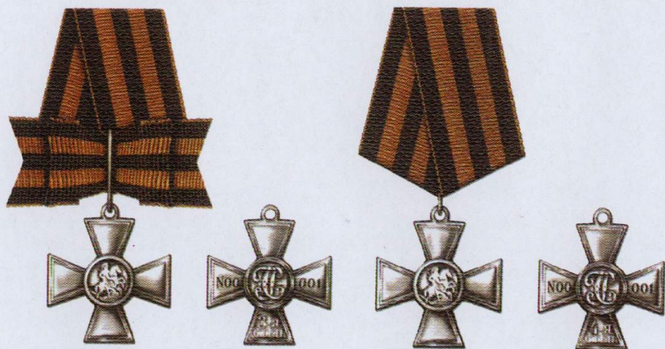
Знак отличия — Георгиевский Крест III степени