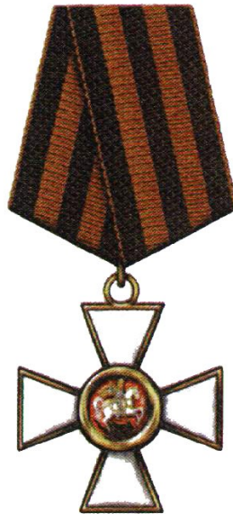
Орден Святого Георгия IV степени

II степень. Знак и звезда ордена те же, что и у ордена I степени. Знак ордена из серебра с позолотой. Носится на шейной ленте шириной 45 мм.