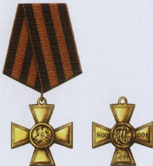
Знак отличия — Георгиевский Крест II степени