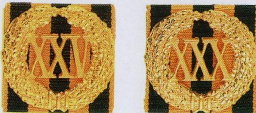
Знак отличия «За безупречную службу» (на георгиевской ленте)